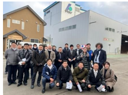
見学先「(株)花巻バイオマスエナジー様」前で岩手青年部様との記念写真

岩手県青年部及び事務局の皆さまには見学からご一緒いただき、バスや情報交換会会場のご予約等で大変お世話になり、誠にありがとうございました。