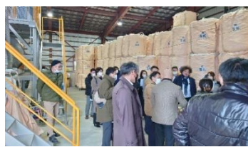
【見学先②】 (株)スパット北上様