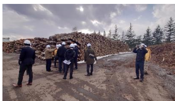
【見学先①】 (株)花巻バイオマスエナジー様